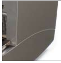
Grigio Grey Gris Gris Grau