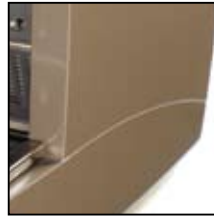
Sabbia Sand Arena Sable Sand RAL 1035