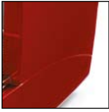
Rosso metallizzato Metallic red Rojo metalizado Rouge métallisé Rot metallisiert