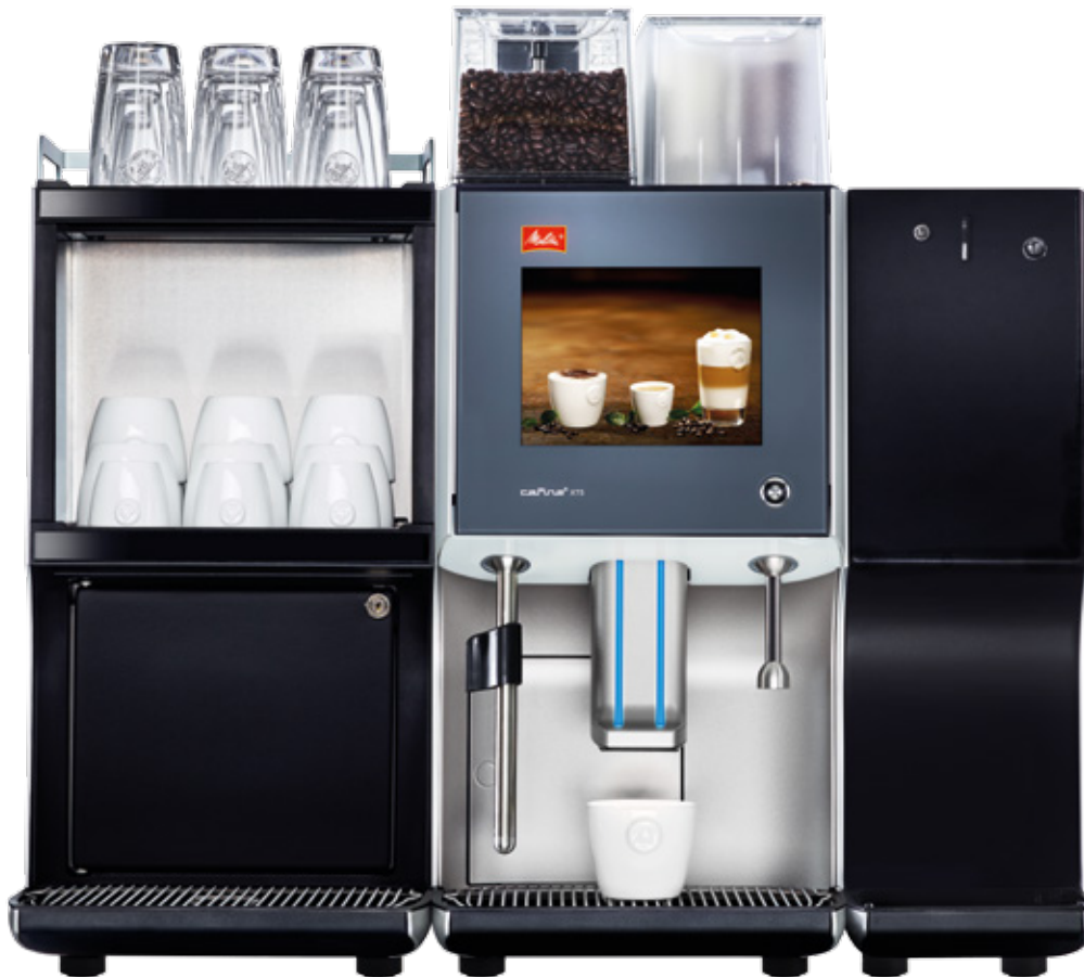
Abbildung zeigt die Melitta® Cafina® XT5 mit dem Milchkühlschrank / Tassenwärmer MC-CW30 und dem Münzwechsler XT CC

DER 8,4-ZOLL-BILDSCHIRM MACHT APPETIT: ZEIGEN SIE, WAS SIE ZU BIETEN HABEN!